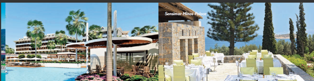
Sensimar Minos Palace