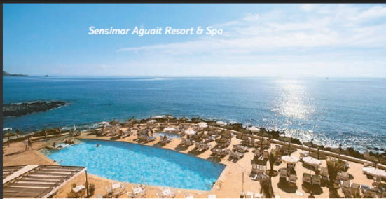
Sensimar Aguait Resort & Spa